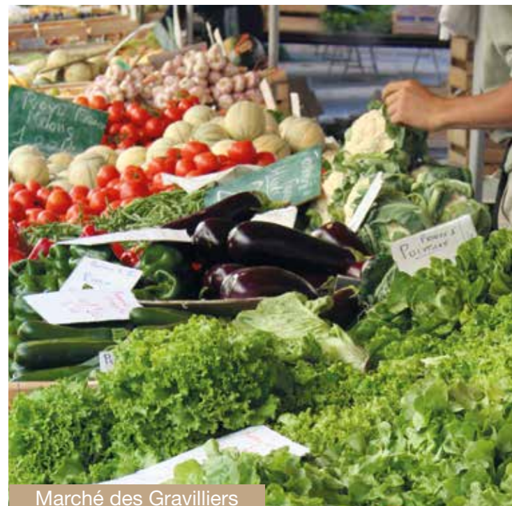
Marché des Gravilliers