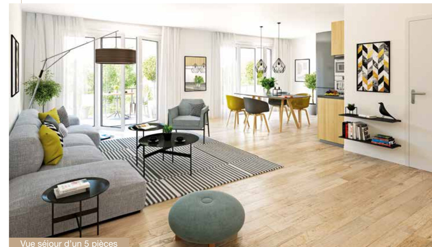
Vue séjour d'un 5 pièces

Bénéficiez de frais de notaire réduits de 2 à 3 % du prix de vente, contre 7 à 8 % dans l'ancien.