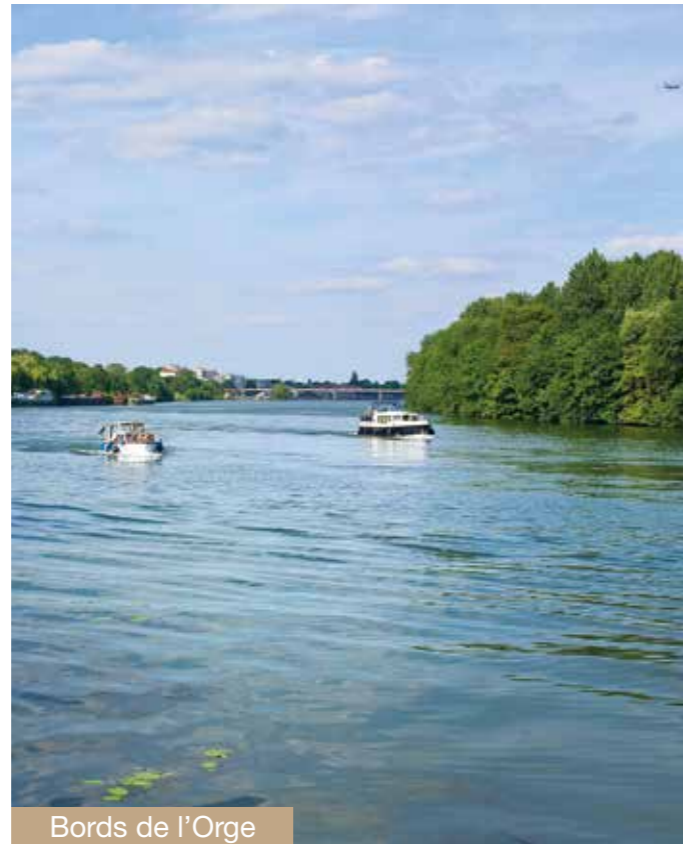
Bords de l'Orge

Athis-Mons, véritable havre de paix assure au quotidien une vie citadine, pratique et pleine d'atouts associée à la douceur de vivre.