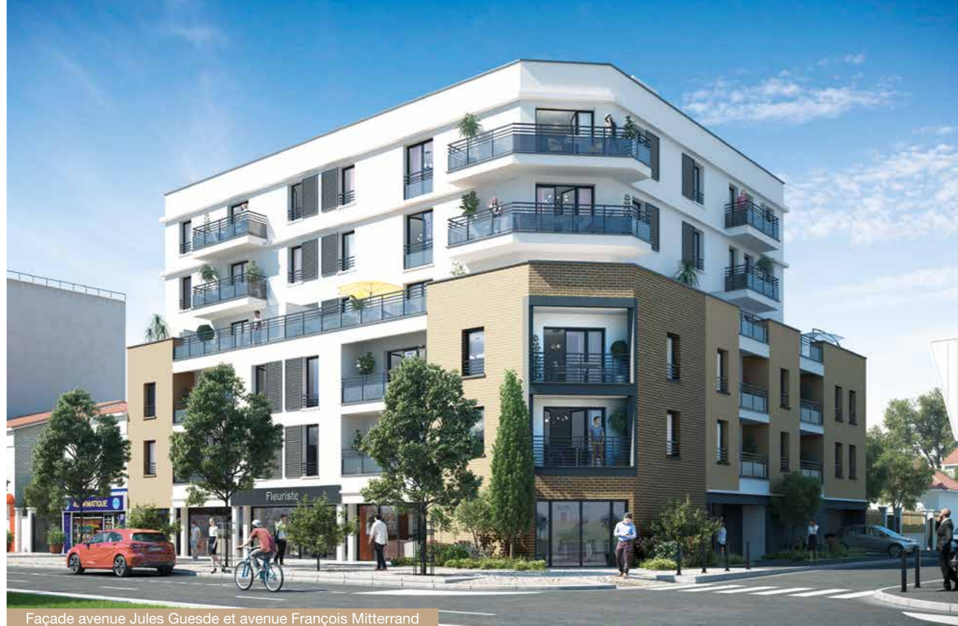
Façade avenue Jules Guesde et avenue François Mitterrand